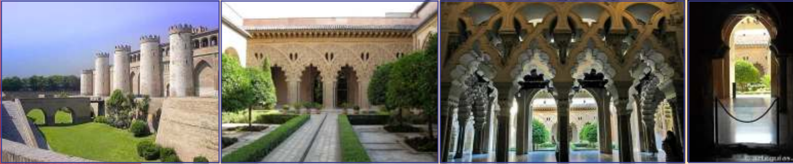
PALA A ALJAFERIA, SARAGOSA